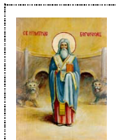
Zavetna Slava Sveti Ignjatije Bogonosac (2. jan / 20. dec)